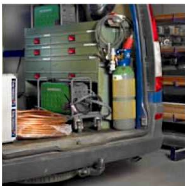
Migatron Delta в комплекте оборудования ремонтных бригад.