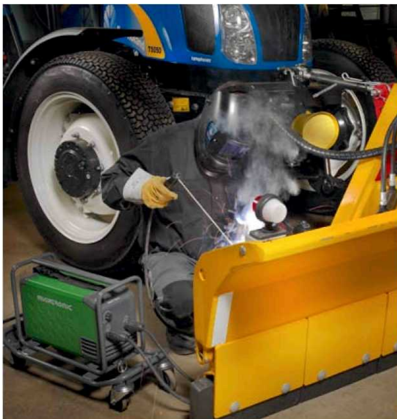
Ремонтная мастерская, Delta в действии – с защитной рамой на тележке