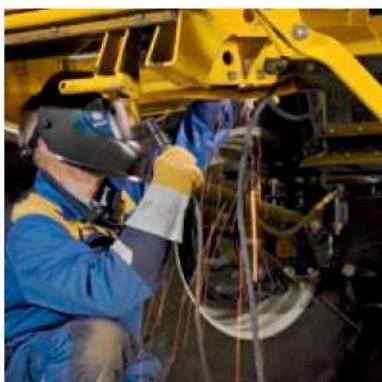
Migatron Delta – для сварки в труднодоступных местах