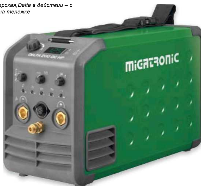
Delta 200 DC HP – самая мощная версия для TIG сварки с функцией импульса и диапазоном тока от 5 до 200 А.